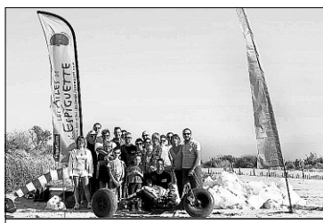
Une vingtaine de personnes a écumé la plage pour la nettoyer.

A la fin de la journée, pas moins de 45 sacs de déchets avaient été récoltés, détruisant ainsi le chiffre de 2007