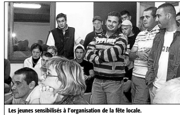
Les jeunes sensibilisés à l'organisation de la fête locale.

Une dernière réunion d'informations pour laquelle la jeunesse de la cité était convoquée, concernant la fête locale, a eu lieu fin septembre à la salle Joseph-Servel, à la caserne des pompiers.