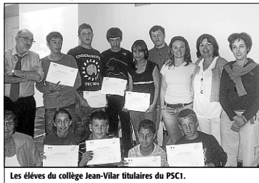
Les élèves du collège Jean-Vilar titulaires du PSCI.